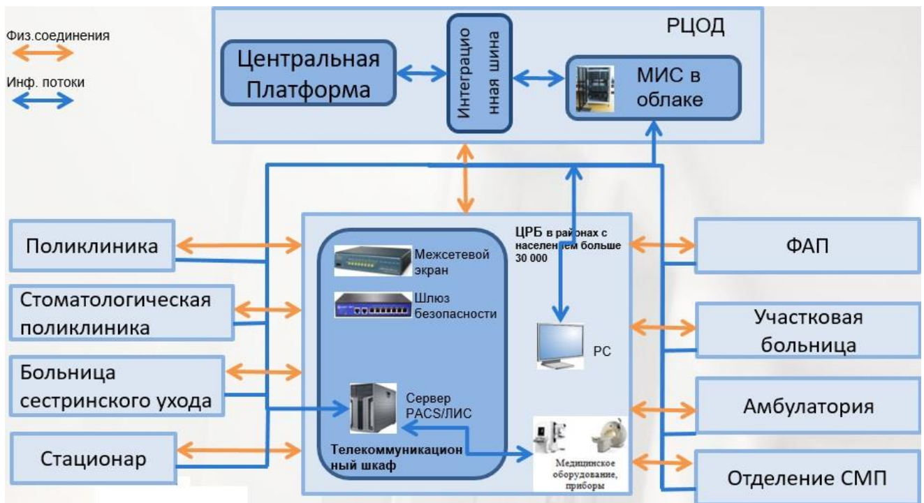
Рис. 2. Архитектура нижнего уровня ЦИСЗ для организаций здравоохранения в регионах с населением меньше 30 000 человек