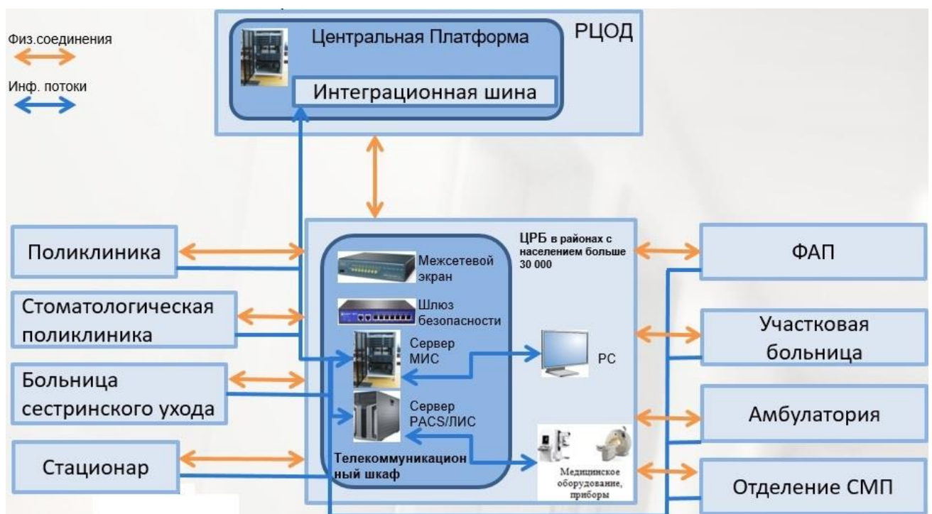
Рис. 3. Архитектура нижнего уровня ЦИСЗ для организаций здравоохранения в регионах с населением больше 30 000 человек

В процессе реализации Концепции после сдачи первого этапа по интеграции организаций здравоохранения с ЦП и в случае необходимости замены (модернизации) серверного оборудования предполагается поэтапное размещение серверных мощностей и информационных ресурсов крупных организаций здравоохранения на республиканской